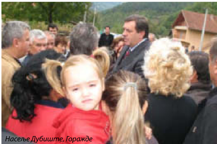
Насеље Дубиште, Горажде