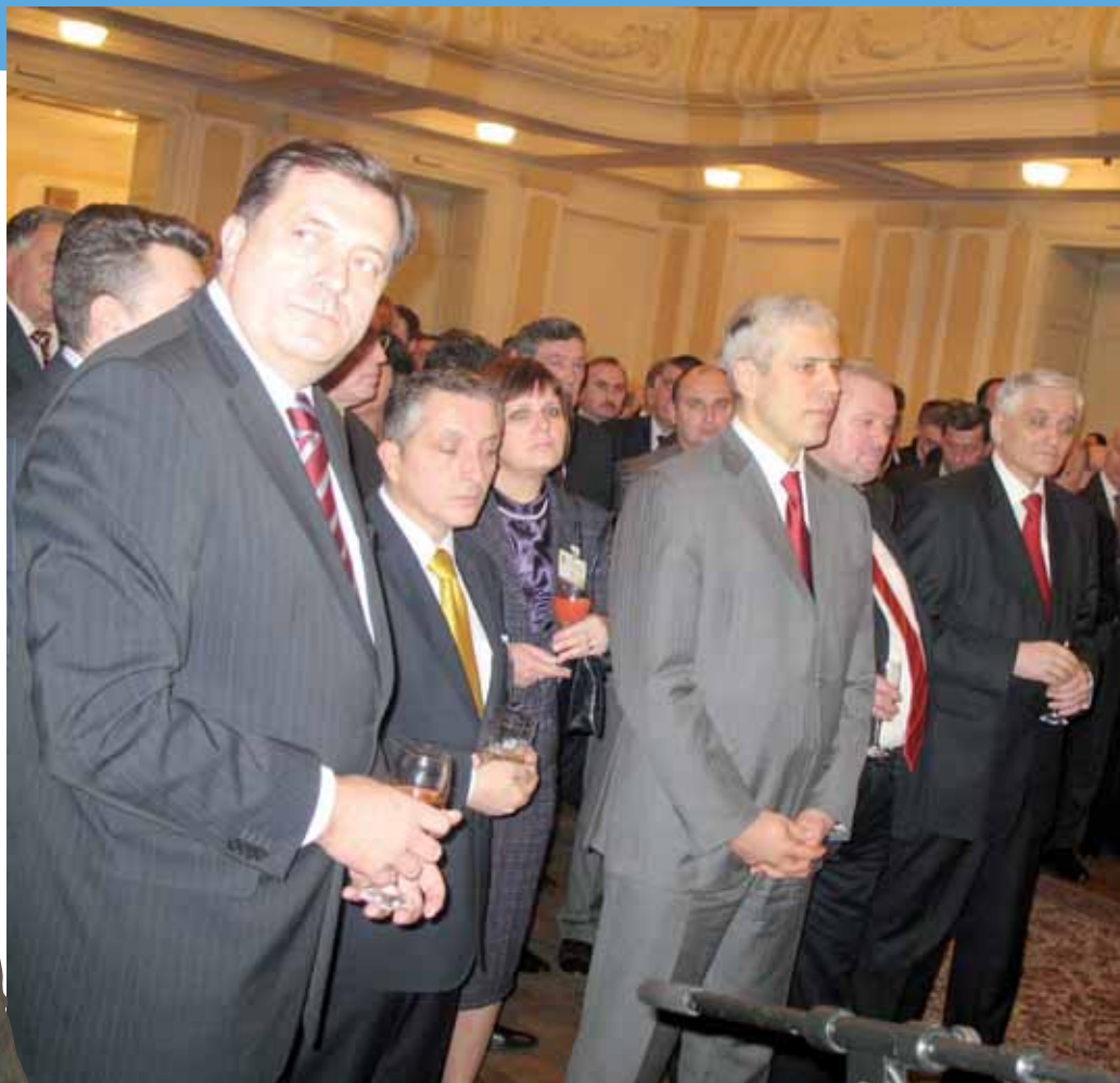
Пријем код предсједника РС Рајака Кузмановића