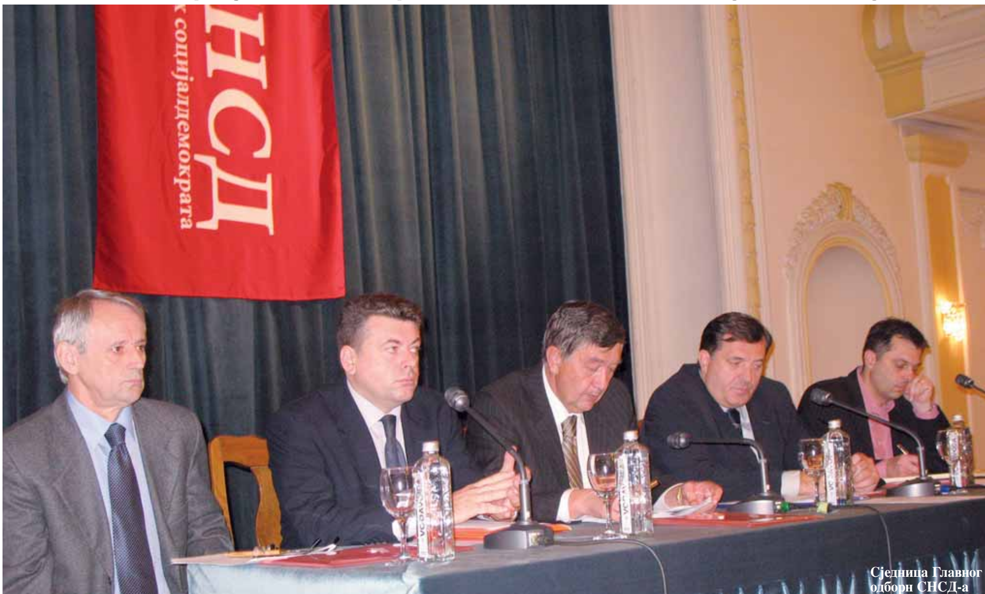
Сједница Главни одбор СНСД-а

■ Од 19. октобра у Босни и Херцеговини више ништа није као што је било.